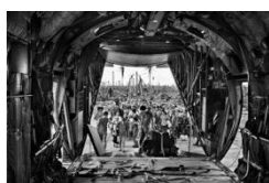
Veejay Villafranca, Evacuation, 2013;

Aus der Serie/from the series » Signos «.