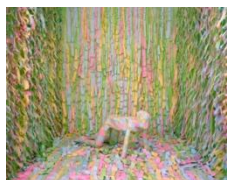
Gina Osterloh, Dots Front Misfire, 2008;

Aus der Serie/from the series » Cut Room «.