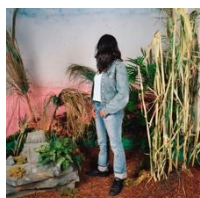
Gina Osterloh, Looking Back I Accepted Your Invitation, 2005

Aus der Serie/from the series » Somewhere Tropical «.